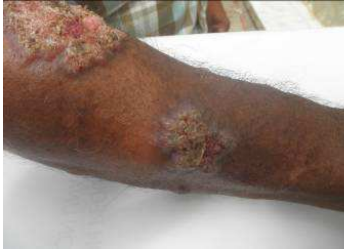
Figura 1: Paciente de la zona semiárida del estado Falcón, con lesiones verrugosas en miembro superior.

se presenta en los tejidos parasitados como células fumagoides, muriformes (Esclerotes de Medlar) Ver Figura 2. (Arenas et al 2004, Richard 2005, Bonifaz, 2010).