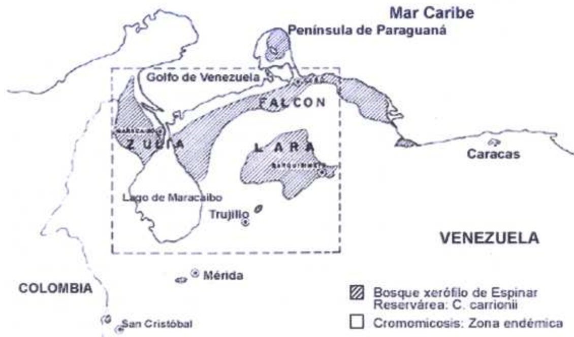
Figura 3: Zona Endémica Noroccidental de Cromomicosis (Estados Falcón, Zulia y Lara).Reservarea: Semiárida, para Cladiophialophora Carrionii . Sub-húmeda, para Fonsecaea pedrosoi .

La zona seca de Falcón es "Reservarea" de esta especie (Figura 1), según se pudo comprobar por el aislamiento repetido de este hongo en varias plantas xerófilas (Richard et al 2005). En las zonas subhúmedas de las zona endémica los pacientes son infectados por Fonsecaea pedrosoi (Brumpt 1922, Negroni 1936), siendo este el segundo agente causal más frecuente en Venezuela. Se han reportado ocasionalmente otras especies causales. (Richard et al 2005).