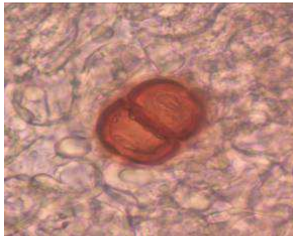
Figura 2: Cuerpo Esclerótico de C. carrionii .