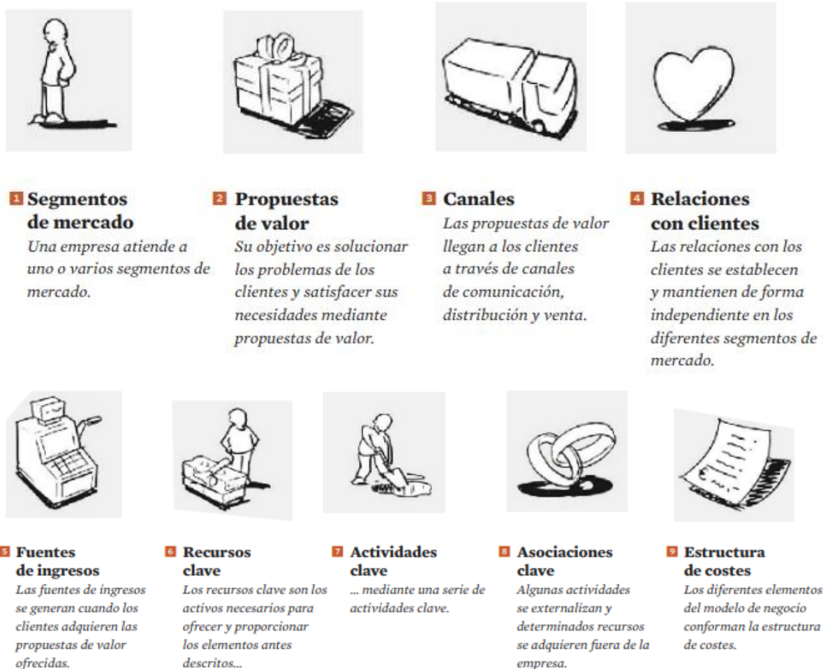
Figura 2. Infograf6a los nueve m6dulos. Tomado de (Osterwalder y Pigneur, 2017, p. 3).